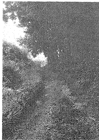
現在の川西横山通 字古道から田沢の集落へ入る地点（手前が田沢）。

各地のな祭りが行われる場所）の高札場のあった四辻を起点に、旧道を拡幅した現在の県道樽石河北道沿いに大久保まで歩きます。途中、茅葺きの家が点在する大原（旧宝田村）には、この地を開発した高谷家が残っており、庭にそびえる臥竜松はかつて「大原の馬つなぎ松」ともいわれ、馬方の往来が偲ばれます。