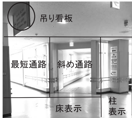
図2. 分岐地点(図1での星印)における視線エリアの分類 吊り看板;上方の表示で「病棟」との表示がある、柱表示;右側にあり「病棟エレベータ」と矢印がある、最短通路;左側にあり最短で病棟エレベータへ向かうことができる、斜め通路;中央にある、床表示;病棟に向かうのに必要でない情報のみである。

路について、最短で到達した被検者4名は、図1の実線で示す経路を取った(最短経路群)。最短経路で到達できなかった被検者3名(迷い経路群)の経路のうち、代表例を図1の破線で示す。最短経路群と迷い経路群の違いは、病棟エレベータを探す手がかりとなる表示があり、廊下が3方向に分岐している地点(分岐地点、図1の星印)での経路選択にあったため、この地点での各被検者の視線を検討した。