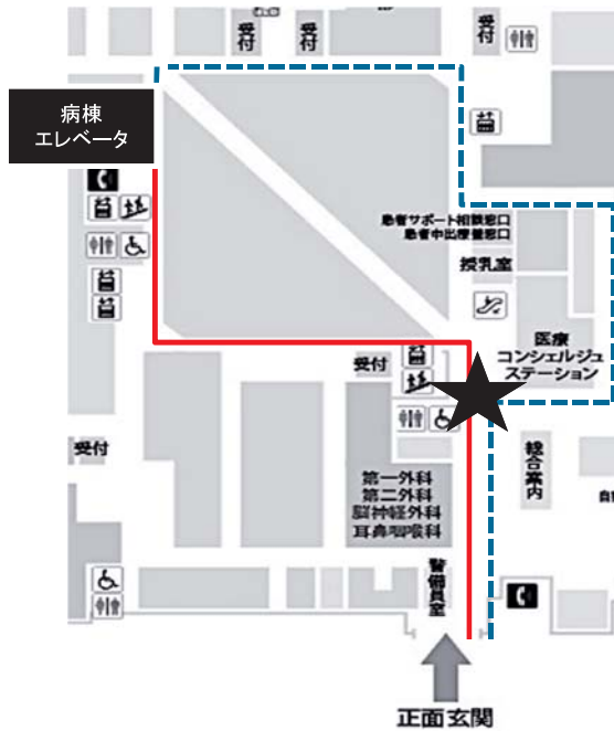
図1. 病院正面玄関から病棟エレベータへの経路 実線;最短で到達した健常被検者(最短経路群)の経路、破線;最短経路で到達できなかった健常被検者(迷い経路群)の経路のうちの一つ、星印;この経路において最短で到達できるか否かを決定していた重要な表示のある分岐地点