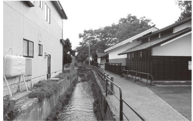
図表2 舟運に使われた河川と蔵（右がやませ蔵）