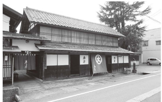
図表3 歴史的建造物（丸大扇屋）

以下では、長井市における最上川に関連した地域資源の具体的な活用事例と、今後の活用の方向性について述べる。